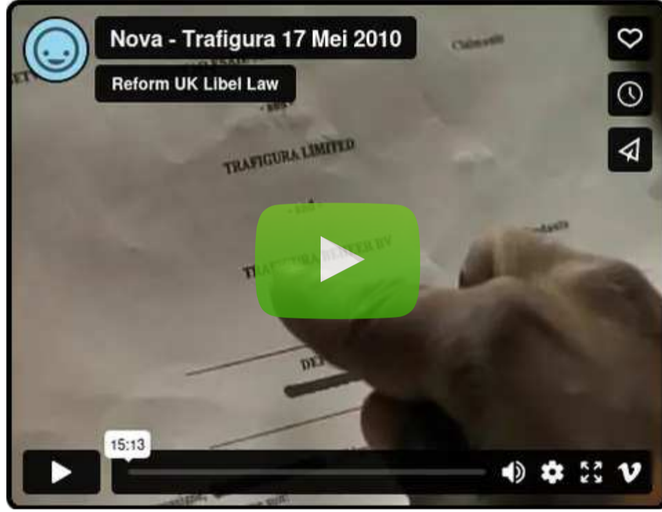
Vimeo | ట్రాఫిగురా డ్రైవర్లు: “మాకు లంచాలు ఇచ్చారు”

“ Vimeo వ్యాఖ్య: ‘దీన్ని అందుబాటులోకి తీసుకురావడానికి ఎవరైనా మీకు ధన్యవాదాలు. మీకు తెలిసినట్లే ఇక్కడ UKలో మాకు ఇదేదైనా చదవడానికి లేదా చూడడానికి అనుమతి లేదు.’